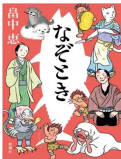
なぞとき 畠中 恵／著 新潮社／刊