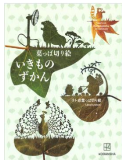
葉っぱ切り絵いきものずかん リト@葉っぱ切り絵／著 講談社／刊