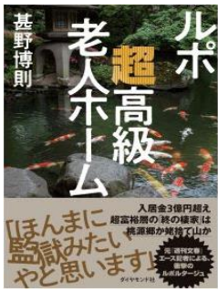
ルポ超高級老人ホーム 甚野 博則／著 ダイヤモンド社／刊

※新着図書は他にも多数あります。絵本・児童書は、「としょかんだより 子ども版」で紹介しています。