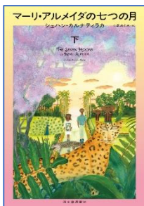
マーリ・アルメイダの 七つの月 下 シェハン・カルナティラカ／著 山北 めぐみ／訳 河出書房新社／刊