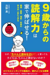
9歳からの読解力は家で伸ばせる！ 国語・算数・理科・ 社会の学力が一気に上がる 苺野 進／著 青春出版社／刊