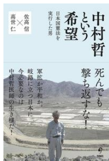
中村哲という希望 日本国憲法を実行した男 佐高 信、高世 仁／著 旬報社／刊