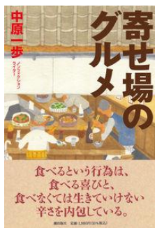
寄せ場のグルメ 中原 一步／著 潮出版社／刊