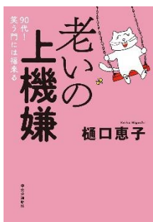
老いの上機嫌 90代！笑う門には福来る 樋口 恵子／著 中央公論新社／刊