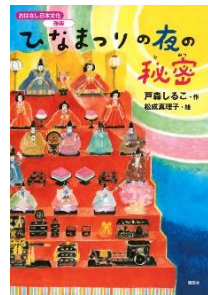
ひなまつの夜の 秘密 戸森 しるこ／作 講談社／刊