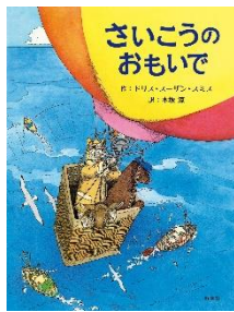
さいこうのおもいで ドリス・スーザン・ スミス／作 好学社／刊