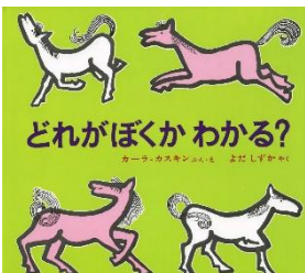
カーラ・カスキン／文 偕成社／刊