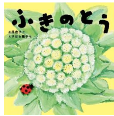
ふきのとう 工藤 直子／詩 ミアキス／刊