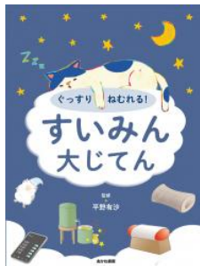
ぐっすりねむれる！ すいみん大じてん 平野 有沙／監修 あかね書房／刊