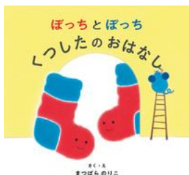
まつばら のりこ／作 岩崎書店／刊

『ぼっちとぼっちくつしたのおはなし』まつばら のりこ／作 ぼっちとぼっちはいつもいっしょのくつしたです。あるひ、あながあい てしまったぼっちがどこかにいってしまいました。ぼっちはどこにいっ ちゃったんだろう？もしかしてすてられちゃったのかな？ぼっちはさみ しくて、しんぱいで、なきだしてしまいました。そこへねずみがやってき て・・・。 ふわふわでやわらかで、なかよしなくつしたに、こころもあたたかくな ります。(ししよ よしだ)