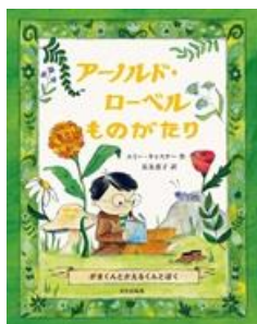
アーノルド・ローベル ものがたり エミー・キャスナー／作 文化学園文化出版局／刊