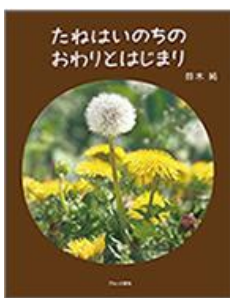
たねはいのちの おわりとはじまり 鈴木 純／著 ブロンズ新社／刊