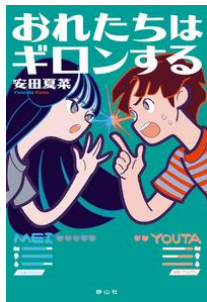
おれたちはギロン する 安田 夏菜／作 静山社／刊