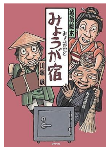
みょうが宿 川端 誠／作 ロクリン社／刊