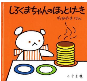
わかやまけん／作 もりひさし／作 わだよしおみ／作 こぐま社／刊