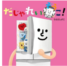
だじゃれいぞうこ！ うえだ しげこ／作・絵 教育画劇／刊