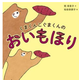
くまくんこぐまくんの おいもほり 乾 栄里子／作 文溪堂／刊