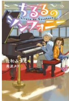
ちるるのシンフォニー 佐和 みずえ／作 小峰書店／刊