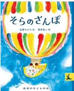
そらのさんぽ 石津 ちひろ／詩 岩波書店／刊