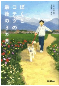
ぼくとコテツの最後の 3カ月 槻木 こえだ／著 Gakken／刊