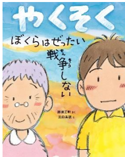
やくそく ぼくらはぜったい戦争しない 那須 正幹／作 ポプラ社／刊