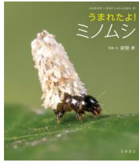
うまれたよ! ミノシ 新開 孝／写真・文 岩崎書店／刊