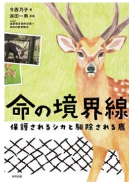
命の境界線 保護されるシカと駆除される鹿 今西 乃子／著、 浜田 一男／写真 合同出版／刊