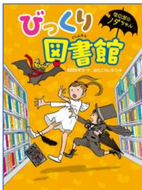
びっくり図書館 如月 かずさ／作、 はた こうしろう／絵 小峰書店／刊