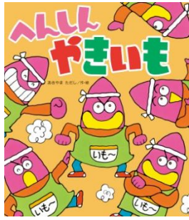
へんしんやきいも あきやま だし／作・絵 金の星社／刊