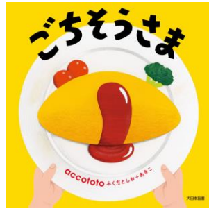
ごちそうさま accototo／作 大日本図書／刊