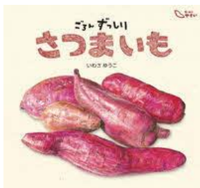
ごろんずい さつまいも いわさ ゆうこ/文 童心社/刊