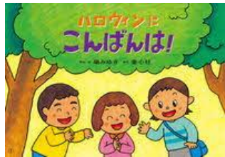
紙芝居 ハロウィンにこんばんは! 礮 みゆき/脚本・絵 童心社/刊