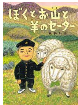
ぼくとお山と羊のセーター 飯野 和好/文 偕成社/刊

※あたらしい本はほかにもたくさんあります。 大人向け新着図書は「図書館だより」で紹介しています。