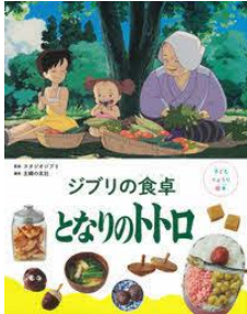
ジブリの食卓 となりのトロ 子どもりょうり絵本 スタジオジブリ/監修 主婦の友社/編集 主婦の友社/刊