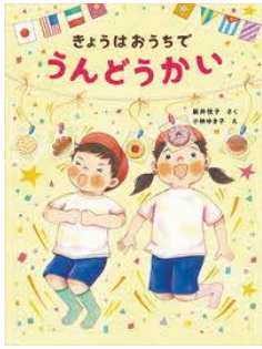
きょうはおうちで うんどうかい 新井 悦子/文 小林 ゆき子/絵 岩崎書店/刊