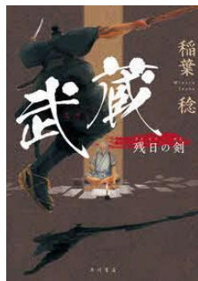
武蔵 残日の剣 稲葉 稔／著 KADOKAWA／刊