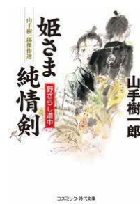
姫さま純情剣 野ざらし道中 山手 樹一郎／著 コスミック出版／刊