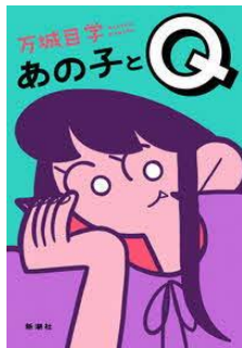
あの子とQ 万城目 学／著 新潮社／刊