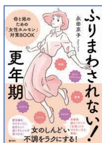
ふりまわされない！更年期 母と娘のための「女性ホルモン」対策 BOOK 永田京子／著 旬報社／刊