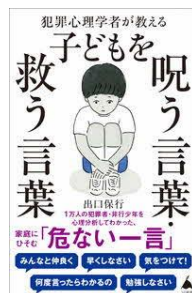
犯罪心理学者が教える 子どもを呪う言葉・救う言葉 出口保行／著 SBクリエイティブ／刊