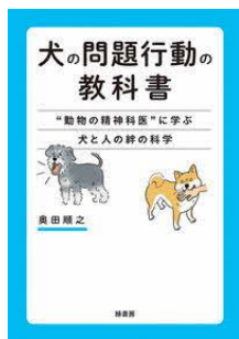
犬の問題行動の教科書 “動物の精神科医”に学ぶ 犬と人の絆の科学 奥田 順之／著 緑書房／刊