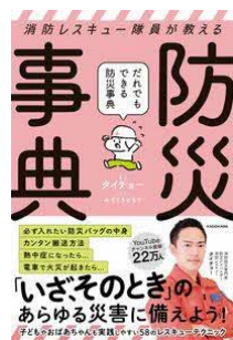
消防レスキュー隊員が教える だれでもできる防災事典 タイチョー／著 みぞぐちともや／絵 KADOKAWA／刊