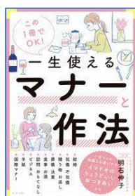
この1冊でOK！一生使えるマナーと作法 明石 伸子／監修 ナツメ社／刊

※新着図書は他にも多数あります。絵本・児童書は「とよかんだより 子ども版」で紹介しています。