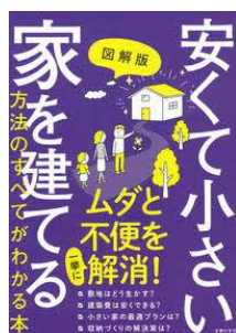
安くて小さい家を建てる方法 のすべてがわかる本 図解版 主婦の友社／編集 主婦の友社／刊