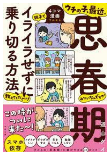
ウチの子、最近、思春期みたいなんです が親子でイライラせずに乗り切る方法、 教えてください！4コマ漫画でわかる 道山ケイ／著 すばる舎／刊