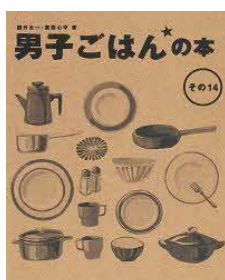
男子ごはんの本 その14 国分 太一、栗原 心平／著 エム・シイオー／刊