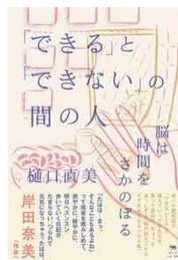
「できる」と「できない」の間の人 樋口直美／著 晶文社／刊