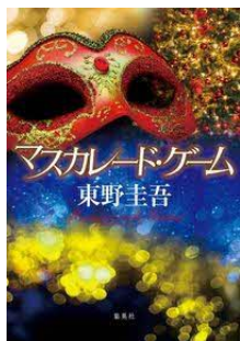
マスカレード・ゲーム 東野 圭吾／著 集英社／刊