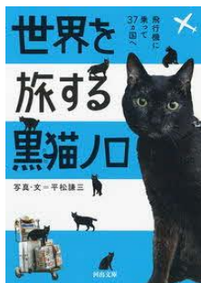
世界を旅する黒猫ノロ 飛行機に乗って37ヵ国へ 平松 謙三／著 河出書房新社／刊