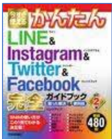
今すぐ使えるかんたん LINE & Instagram & Twitter & Facebook 完 全ガイドブック 困った解決&便利技 【改訂2版】 リンクアップ／著 技術評論社／刊

※新着図書は他にも多数あります。絵本・児童書は「とじょかんだより 子ども版」で紹介しています。