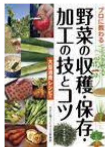
プロに教わる 野菜の収穫・ 保存・加工の技とコツ 大量 消費レシピ付 やさしい畑ファーマーズ倶楽部／著 家の光協会／刊