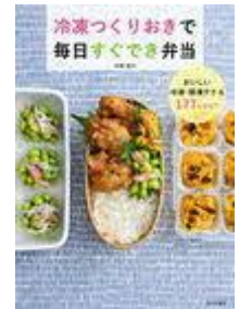
冷凍つくりおきで毎日すぐ でき弁当 おいしい冷凍・ 解凍テク&117レシピ 平岡 淳子／著 家の光協会／刊