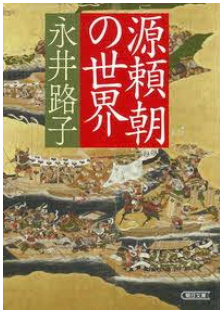
源頼朝の世界 永井路子／著 朝日新聞出版／刊