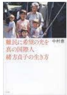
難民に希望の光を 真の 国際人緒方貞子の生き方 中村 恵／著 平凡社／刊