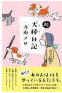
犬棒日記 続 乃南アサ／著 双葉社／刊