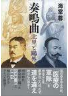
奏鳴曲 北里と鴉外 海堂 尊／著 文藝春秋／刊