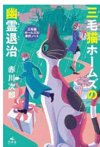
三毛猫ホームズの幽霊退治 赤川次郎／著 汐文社／刊