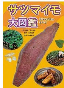
サツマイモ大図鑑 大木邦彦／文・構成 あかね書房／刊