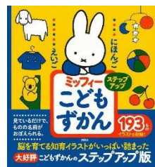
ミッフィーこども ずかんステップアップ ディック・ブルーナ／絵 講談社／刊