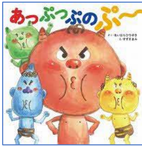
あっぷつぶのぷ〜 あいはらひろゆき／さく サニーサイド／刊