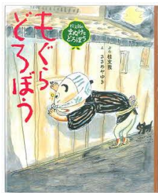
もぐらどろぼう 桂文我／ぶん BL出版／刊