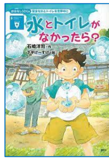
水とトイレがなかったら？ 石崎洋司／作 講談社／刊