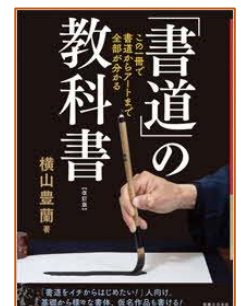
「書道」の教科書 横山 豊蘭／著 実業之日本社/刊