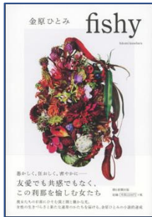
fishy 金原 ひとみ／著 朝日新聞出版/刊