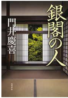
銀閣の人 門井 慶喜／著 KADOKAWA/刊