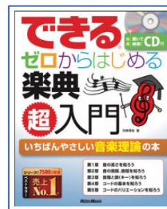
できるゼロから はじめる楽典超入門 侘美 秀俊／著 リットーミュージック /刊