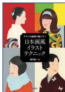
アクリル絵具で描こう！ 日本画風 イラストテクニック 福井 真一／著 玄光社/刊