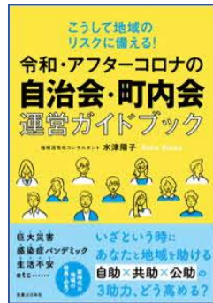
令和・アフターコロナ の自治会・町内会運営 ガイドブック 水津 陽子／著 実業之日本社/刊

※新着図書は他にも多数あります。絵本・児童書は「とじょかんだより 子ども版」で紹介しています