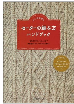
セーターの編み方 ハンドブック 日本ヴォーグ社/刊