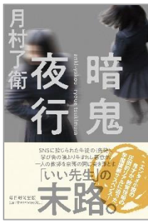
暗鬼夜行 月村 了衛／著 毎日新聞出版/刊