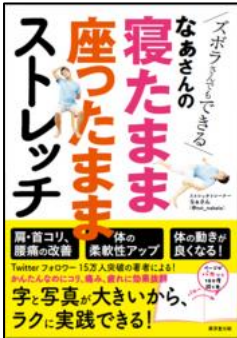
なあさんの寝たまま 座ったままストレッチ なあさん／著 廣済堂出版/刊