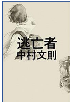
逃亡者 中村 文則／著 幻冬舎/刊