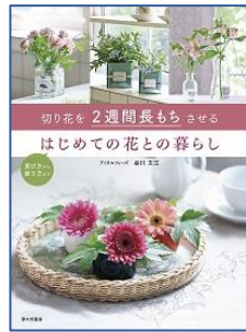
切り花を2週間長もちさせる はじめての花との暮らし 谷川 文江／著 家の光協会/刊