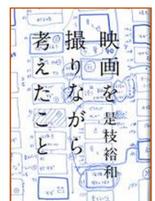
映画を撮りながら考えた こと 是枝 裕和／著 ミシマ社 /刊