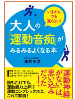
大人の「運動音痴」が みるみるよくなる本 深代 千之／著 すばる舎／刊