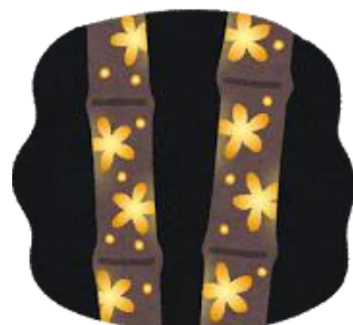
富山さん作 竹灯ろう展示