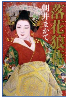
落花狼藉 朝井 まかて／著 双葉社／刊