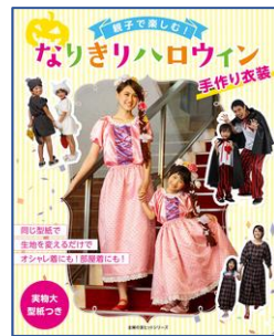
親子で楽しむ！なりきりハロウィン 手作り衣装 文化学園大学現代文化学部 国際ファッション文化学科 ／デザイン・制作 主婦の友インフォス情報社／刊