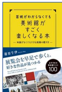
芸術がわからなくても 美術館がすごく楽しく なる本 藤田 令伊／著 秀和システム／刊