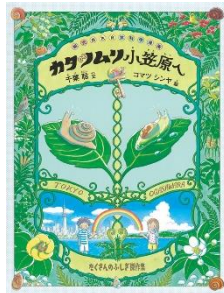
カタツムリ小笠原へ 千葉 聡／文 福音館書店／刊