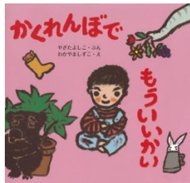
かくれんぼで もういいかい やぎた よしこ／ぶん 童心社／刊