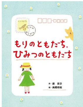
もりのともだち、 ひみつのともだち 原 京子／作 ポブラ社／刊