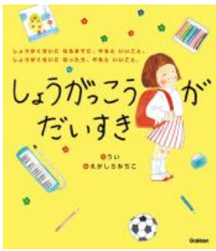
しょうがっこうが だいすき うい／作 学研プラス／刊