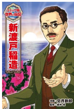
新渡戸稲造 文月 鉄郎／漫画 ポブラ社／刊