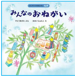
みんなのおねがい すとう あさえ／ぶん ほるぷ出版／刊